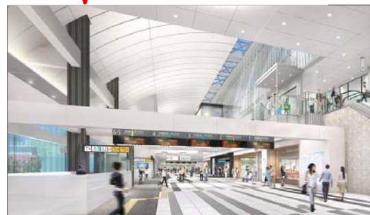
② 改札内コンコースイメージ